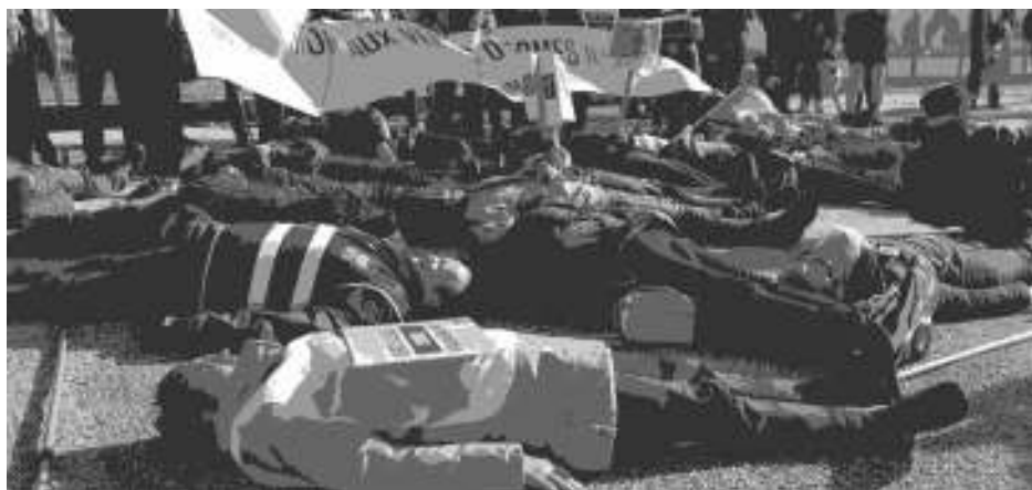
Cherbourg, "dye in" sur le port

Escale louche d'un bateau déjà épinglé pour transfert illicite d'armement.