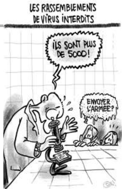
primordiales une fois la crise sanitaire jugulée.

ductions stratégiques. Le Covid-19 servirait d'alerte face à la trop forte dépendance des pays industrialisés à l'égard de la Chine. En 2004, le «made in China» représentait 4% des marchandises pour la consommation mondiale. En 2020, 20%. L'expansion du capitalisme contrée par une pandémie ? Pas sûr que ce vœu pieu de relocalisation résiste aux logiques de profits, redevenant