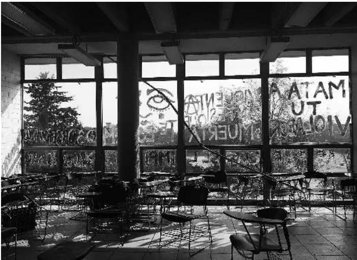
Un hall de l'UNAM, Universidad Nacional Autónoma de México.

La question de l'organisation politique, de la non-mixité ou de la mixité choisie, des rapports de force dans un collectif font l'objet de débats, que les femmes d'aujourd'hui essaient de formaliser en pensant à la suite. Il s'agit de trouver des structures qui permettent la continuité de la lutte, de pérenniser des espaces et des lieux de parole et d'entraide, des stratégies non-autoritaires qui survivent aux années. En quelques semaines, alors qu'il n'y avait jamais eu de papier ni de savon dans les toilettes, elles ont réussi à mettre en place un jardin pour s'alimenter, des salles de bain pour se doucher, des lieux où dormir ou se reposer, et surtout une réalité des rapports humains fondés sur l'écoute et la confiance: la « sororité » en somme.