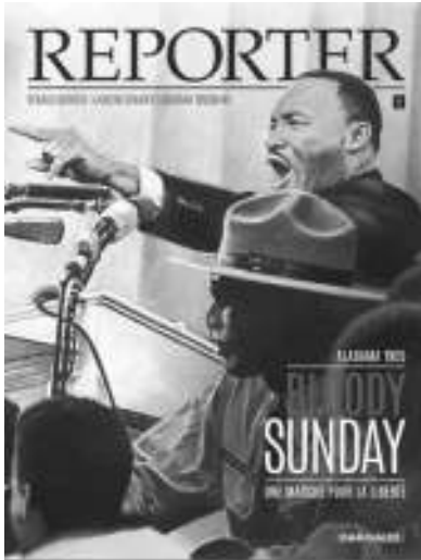
Reporter. 1 : Bloody Sunday, Garetta, Garnier, Toussaint et Charrance. Éd Dargaud, 64 p., 15 euros.

Un jeune journaliste inexpérimenté passe plutôt pour un blanc bec aux yeux du photographe qui lui sert de binôme, un baroudeur, un vieux de la vieille, désabusé, cynique, volontiers raciste. Mais brave type, comme ça se dit, en tous cas quand il faut finalement seconder son acolyte, frère blanc