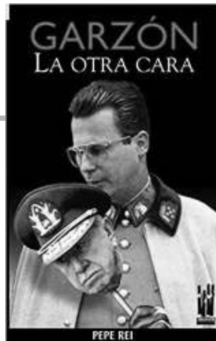
Couverture du livre consacré à Garzón par Pepe Rei (édité par Txalaparta)

Enfin, il est nécessaire de rappeler que les années d'activité de Garzón à l'Audience nationale ont aussi été marquées par de très nombreuses dénonciations de tortures perpétrées