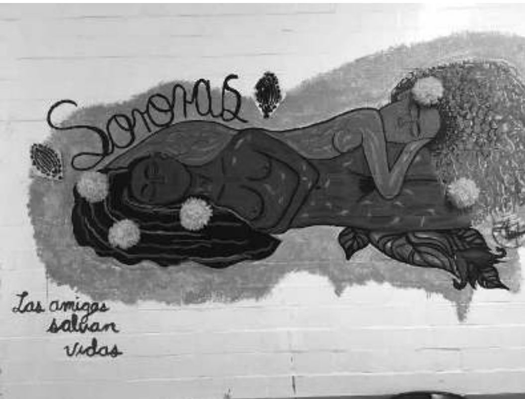
« Sororité : les amies sauvent des vies ! »

CNT Jura Sur la Roche 39370 Les Bouchoux 10 Languedoc Roussillon Union régionale CNT 6, rue d'Arnal 30000 Nîmes ur.lr@cnt-f.org 11 Limousin Union locale Limou-sin 6, rue de Gorre, 87000 Limoges, cnt87@cnt-f.org 12 Lorraine Union régionale CNT ur.lorraine@cnt-f.org UD CNT Moselle 5, place des Charrons, 57000 Metz ud57@cnt-f.org 13 Midi-Pyrénées Union régionale CNT 18, av. de la Gloire, 31 500 Toulouse Tél 09 52 58 35 90 14 Nord-pas-de-Calais Union régionale CNT 32, rue d'Arras, 59000 Lille 03 20 56 96 10 ur59-62@cnt-f.org 15 Normandie Syndicats CNT Calvados BP 02, 14460 Colombelles Syndicats CNT Seine- Maritime BP 411, 76057 Le Havre CEDEX Syndicat CNT Eure interco27@cnt-f.org 16 PACA CNT-STICS 13 c/o 1000 bâbords 61, rue Consolat 13001 Marseille 17 Pays la Loire voir Bretagne 18 Picardie Voir avec Nord-pas-de-Calais 19 Poitou-Charentes Union régionale CNT 20, rue Blaise-Pascal, 86000 Poitiers 05 49 88 34 08 20 Rhône-Alpes Union régionale CNT 44, rue Burdeau 69001 Lyon